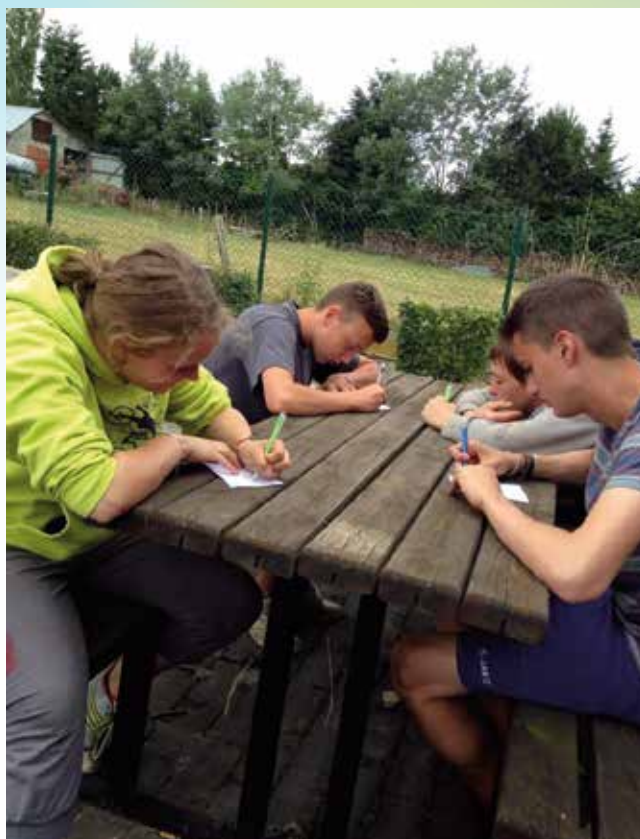
Outre le travail, des temps de réflexion citoyenne

Cette expérience s'est parachevée par un barbecue au Castel de Beauraing. L'ambiance y était bonne enfant et conviviale. Les jeunes ont pu présenter leur travail à différents