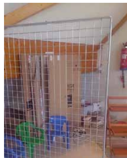
Des grilles d'exposition pour la bibliothèque de Winenne