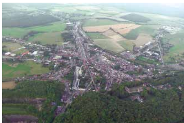
J-M Bourtembourg Beauraing City

Ce concours, organisé en partenariat avec l'Office du Tourisme et le Centre Culturel, a permis à nos deux lauréats de remporter une carte des promenades ainsi qu'un abonnement pour la nouvelle saison du Centre Culturel. L'objectif de la démarche visait essentiellement à récolter des photos en vue d'illustrer les publications communales, tout en plaçant les Beaurinois et leur talent photographique au cœur de ces dernières. Nous remercions toutes les personnes qui ont eu la gentillesse de participer et félicitons une fois encore nos deux gagnants.