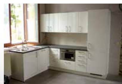
Le local des jeunes de Dion équipé d'une cuisine