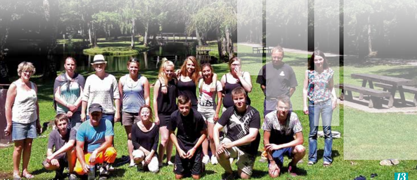
Moment convivial au terme du projet