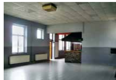
La salle de Baronville rafraîchie

Grâce à ces investissements, certaines salles connaîtront une nouvelle jeunesse; d'autres retrouveront leur aptitude à la location; la plupart encore pourront accueillir de nouvelles activités, comme des après-midis jeux de société, des animations intergénérationnelles, la décentralisation de certains services,... Améliorer la qualité de vie dans nos villages; augmenter l'attrait et la convivialité des lieux de rencontre et lutter contre l'isolement constituent des missions de première importance auxquelles il importe de veiller constamment. Des missions en faveur desquelles les services communaux se sont encore bien investis cet été. Merci à eux.